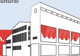
CENTRO CULTURAL CANDIOTA I